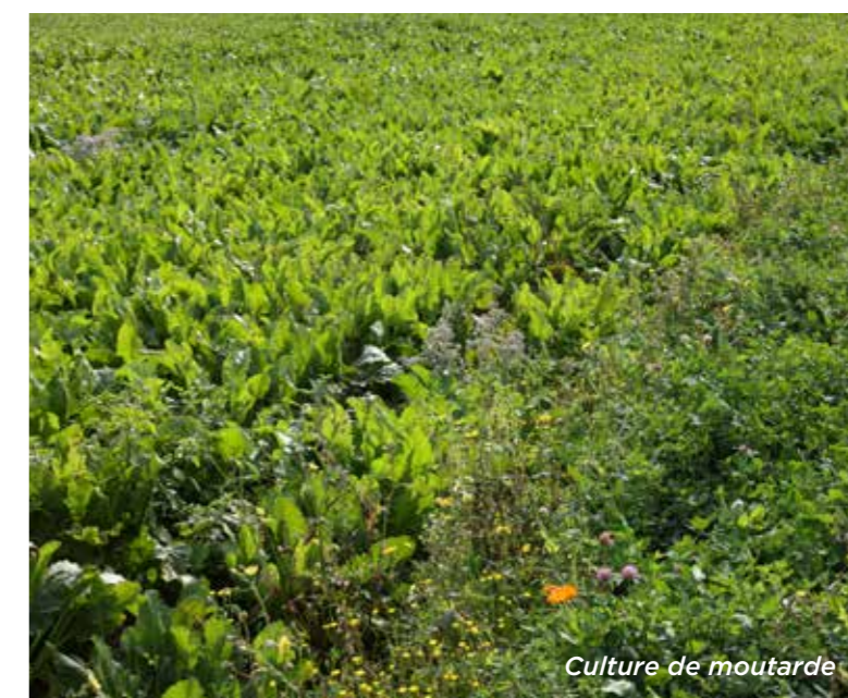
Culture de moutarde

“ De plus, nous ne labourons qu'une année sur trois, afin de préserver la vie du sol. Entre deux cultures, nous implantons des couverts végétaux : cela permet de ne pas laisser les sols nus en hiver, de lutter contre l'érosion, de conserver les nutriments et d'apporter de la matière organique supplémentaire pour la culture suivante. ”